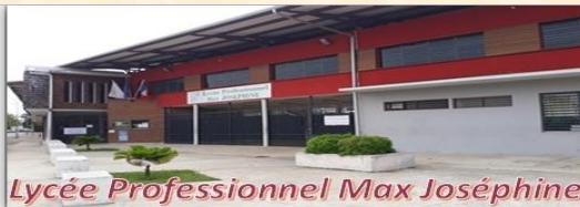
Lycée Professionnel Max Joséphine