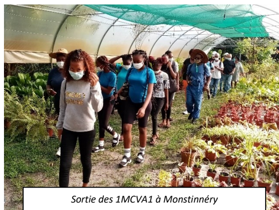
Sortie des 1MCVA1 à Monstinnéry