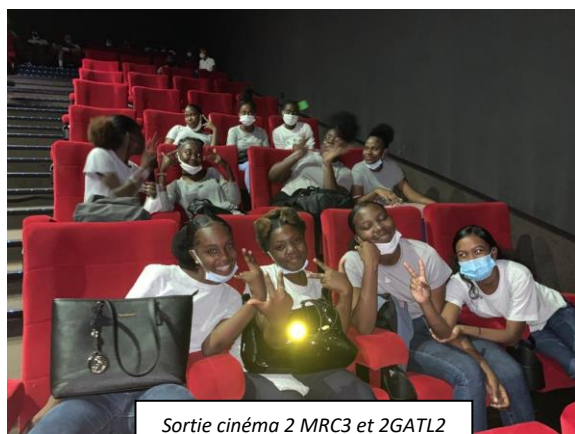
Sortie cinéma 2 MRC3 et 2GATL2